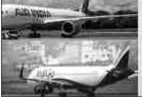
बुधवार को इस मार्ग पर उड़ान उपलब्ध नहीं रहेगी। नागपुर - दिल्ली और नागपुर-मुंबई मार्ग पर भी उड़ानों की संख्या में कटौती की गई है। मुंबई के लिए अब केवल पांच दैनिक उड़ानें संचालित होंगी। वहीं, नागपुर-नवी मुंबई मार्ग पर इंडिगो की उड़ान 6ई-582 केवल 15 जून तक चलेगी। इसके बाद संशोधित शेड्यूल लागू किया जाएगा। इंडिगो की

प्रतिनिधि/प्रतिदिन अखबार नागपुर, 14 जून- विमानन ईंधन (एटीएफ) की बढ़ती कीमतों और परिचालन लागत में इजाफे का असर नागपुर से संचालित उड़ानों पर दिखने लगा है। एयरलाइंस ने कई मार्गों पर उड़ानों की संख्या घटा दी है, जबकि कुछ सेवाएं अस्थायी रूप से बंद की जा रही हैं। सबसे बड़ा असर नागपुर-इंदौर मार्ग पर पड़ा है, जहां 15 जून से दैनिक उड़ान सेवा स्थगित की जा रही है। मिली जानकारी के अनुसार, नागपुर-इंदौर उड़ान 15 जून से बंद रहेगी। यह सेवा 18 जून से फिर शुरू होगी, लेकिन सप्ताह में केवल पांच दिन संचालित होगी। मंगलवार और