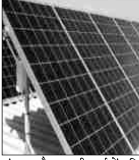
संभावना है। साथ ही खर्च में वृद्धि होने से बड़े सोलर प्रकल्पों का काम भी ठप पड़ा हुआ है। देश में वर्तमान में करीबन 210 गिगावॉट क्षमता के सोलर पैनल बनाए जाते हैं। उसके लिए आवश्यक सोलर सेल्स की करीब 90 प्रश. आयात चायना से की जाती है। सोलर सेल्स की निर्मिती करने वाले गीने-चुने ही

प्रतिनिधि/प्रतिदिन अखबार नागपुर, 14 जून - केंद्र सरकार के नए नियमों के कारण सोलर पैनल महंगे हो गए हैं। बड़ी हुई कीमतों की वजह से उद्योग-व्यवसायियों द्वारा सोलर प्रकल्प बैठाए नहीं जा रहे हैं। पूरे देश में अनेक प्रकल्प प्रलंबित होने की वजह से व्यवसाय का आर्थिक गणित प्रभावित हो गया है। चीन में जाने वाले विदेशी चलन को रोकने के लिए केवल देशांतर्गत निर्माण होने वाले सौर घट (सोलर सेल) इस्तेमाल करने की केंद्र सरकार की नीति के कारण सोलर पैनल उत्पादन का प्रश्न गंभीर हो रहा है। देशांतर्गत सोलर सेल की किल्लत है, नए नियमों की वजह से सोलर ऊर्जा उत्पादकों के टारगेट्स को रोक लगने की