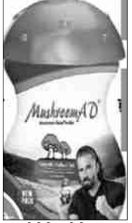
प्रतिनिधि/प्रतिदिन अखबार नागपुर, 14 जून- वजन बढ़ाने का दावा करने वाली एक आयुर्वेदिक हेल्थ पावडर के

►► मेडिकल में चौंकाने वाले मामले आए सामने ►► 'मशरूम एडी' पावडर के चक्कर में युवा हो रहे दिव्यांग